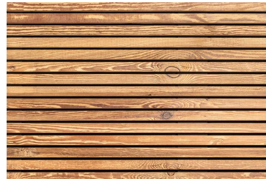
Marilyne 8/25, ALTHOLZ 4

Akustikpaneele mit Deckschicht aus Altholz