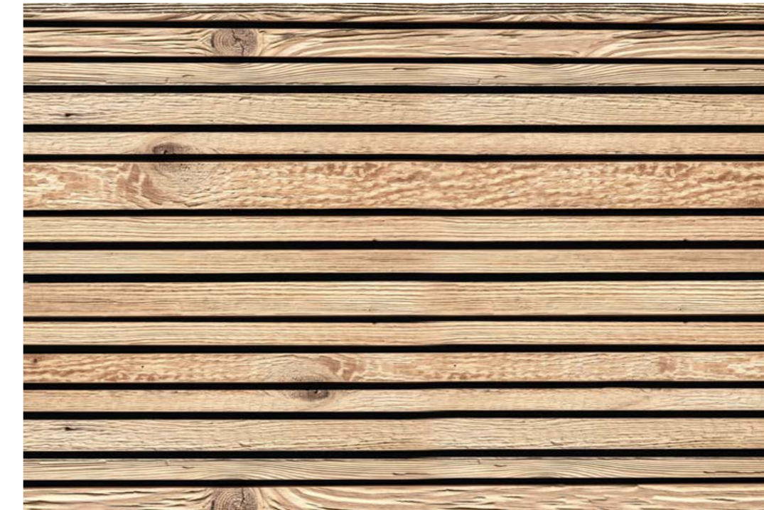
Marilyne S3, ALTHOLZ 1