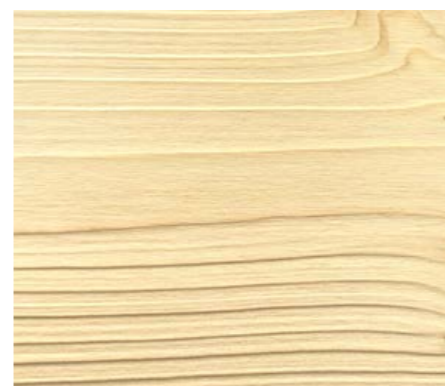
Leicht oder stark gebürstet