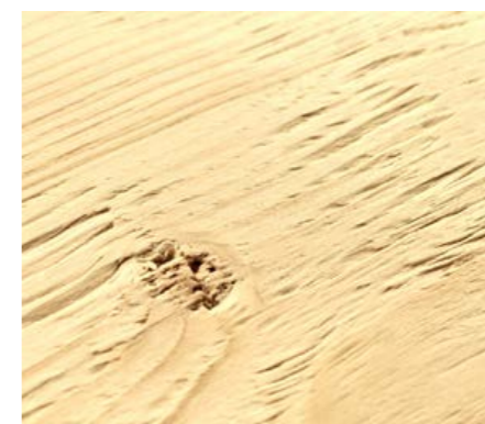
Gehackt und gebürstet